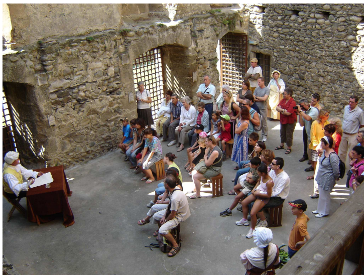
La grande salle dont on dit qu'elle était la galerie des glaces ! Ici aux journées du patrimoine de 2007.

D'autres questionnements peuvent aussi trouver réponse par l'apport de témoignages écrits ou verbaux.