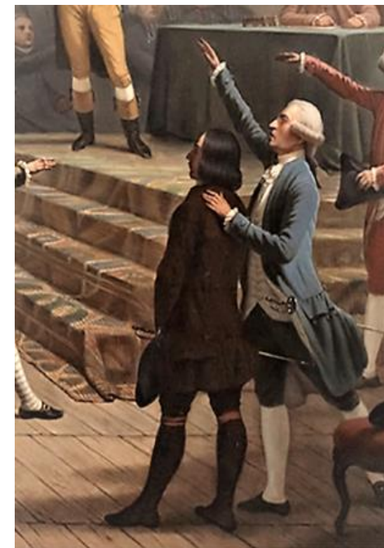
Timoléon de Murinais à l'Assemblée de Vizille, la main sur l'épaule d'un De Richaud dit Patte d'Ours, de cette famille de bûcherons annoblée par un Dauphin